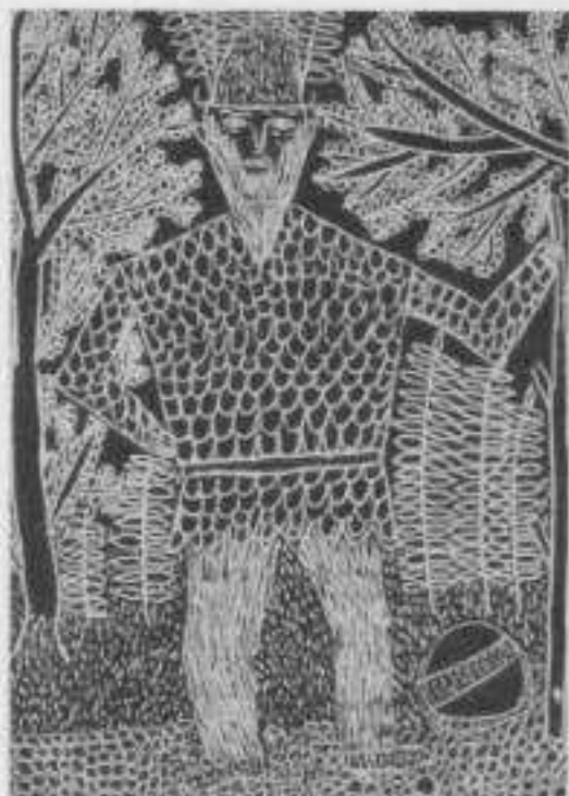
«Das Wurzelmännlein» aus «Tischlein deck dich», Hauptschule, 7. Schuljahr