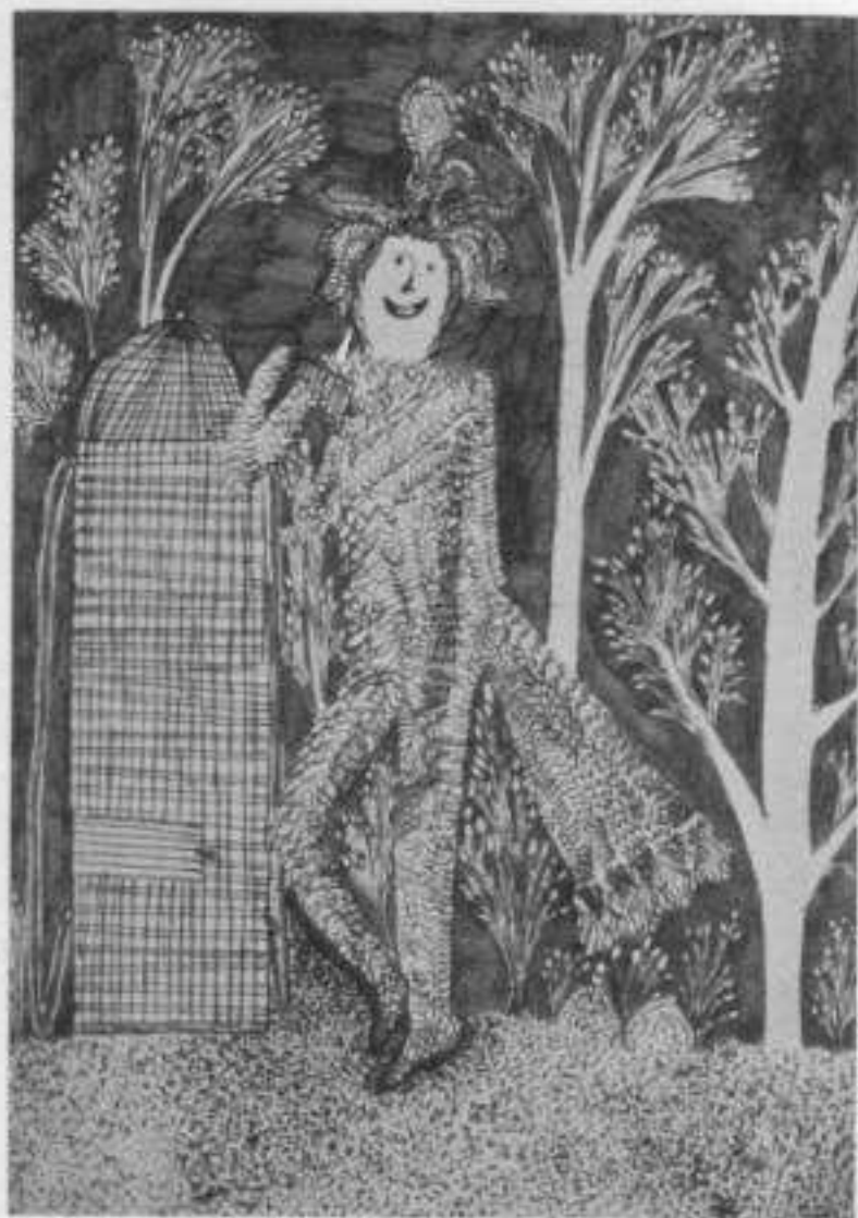
«Papageno» aus «Zauberflöte», von Mozart-Sebastianer, Hauptschule, 9. Schuljahr